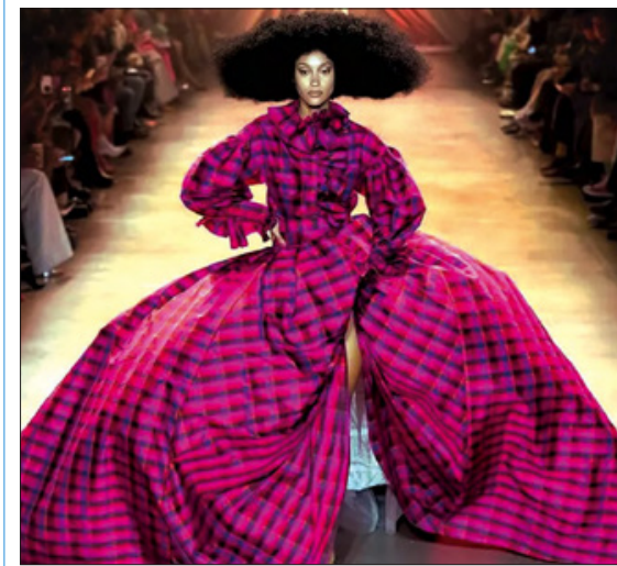
بعد غياب للعروض الباشرة طوال موسمين، يعود أسبوع نيويورك اللوحضة بصيفته الحضورية معلنا عن روثانة «شبه طبيعية» لأول مرة منذ تقضى فيروس كورونا مع بداية العام 2020، فما الجديد الذي سيحمله الينا لدى افتتاحه يوم الأربعاء، وينتد هذا الأسبوع من الأربعاء 8 الجاري حتى الأحد في 12 منه.

في واقعة غريبة أقدم مأذون على الزواج من طفلة بعقد عرفي، ما استدعى فصله من عمله. وترجع تفاصيل القضية إلى إعجاب مأذون في أحد احياء القاهرة بفتاة في الرابعة عشرة من عمرها، فقرر الزواج منها ولم يهتم بنقص سنها عن السن القانونية، وأحضر شهادة من طبيب بانها في السادسة عشرة، واستدعى مأذونا ليعقد قرانتهما فرفض وقال إنه يشبه في صغر سنها، ومع ذلك لم يتراجع المأذون وتزوجها بعقد عرفي. وأبلغ أحد سكان الحي عنه، فقررت وزارة العدل فصله، وتقدم المأذون إلى المحكمة الإدارية يطعن في القرار، وقال مفوض الدولة إن المدعي خالف واجبه فضلا عن أنه شيخ في الأربعين من عمره، وطلب تأييد قرار الفصل. وقضت المحكمة الإدارية لوزارة العدل بإلغاء القرار وقالت في أسباب حكمها إن المسؤول عن هذا الزواج هو الطبيب الذي حذر شهادة التسنين، ووالد الزوجة الذي تستر على زواج ابنته القاصر.