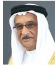
رئيس الأعلى للصحة

الإداري وطلبة الجامعة، الأمر الذي حيينه فيما قامت به الجامعة. فيما قال رئيس الجامعة: «إن هذه العبارات الصادرة من رئيس المجلس الأعلى للصحة، وقعت موقعا جميلا من نفوس جميع منتسبي الجامعة، الذين ما تناولوا اللحظة في تقديم كل ما يمكنهم من أجل القيام بدورهم للمساهمة في ما تحتاجه مختلفة، ولعمد متفاوتة، وذلك تبعاً للدافع الوطني والإنساني. إضافة