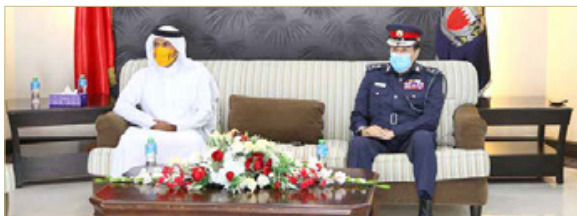
المنامة - وزارة الداخلية

المفتش العام يزور الإدارة العامة للمباحث والأدلة الجنائية