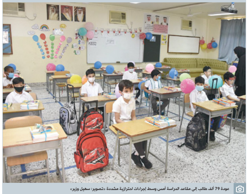
عودة 79 ألف طالب إلى مقاعد الدراسة أمس وسط إجراءات احترازية مشددة

لا تزال الجريمة المروعة التي وقعت في إحدى محافظات صعيد حديث العديد من المصريين على مواقع التواصل. فقد صدمت منطقة العنينا، أهم محافظات صعيد مصر، بعد أن أقدمت امرأتان، على استنزاح طفل يبلغ من العمر 4 سنوات، وقتله بعد بس السدم له في العنصر، أما النسب فمجرد خلافات مع أمه. وانتشرت تفاصيل تلك الجريمة المروعة، بعد أن تبليغ أحد مراكز الشرطة في مديرية أمن العنينا بالمشور على كيس بلاستيكي على حافة إحدى العنصر المانية بدائرة المركز، وبادخله جثة طفل يبلغ 4 سنوات من العمر، بحسب ما نقلت وسائل إعلام محلية. لتظهر التحقيقات لاحقاً أن الطفل الذي كان يقيم في دائرة مركز شرسنة شمالوط، تغيب عن مسكنه منذ 25 أغسطس الماضي.