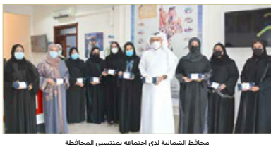
محافظ الشمالية لدى اجتماعه بمنسوبي المحافظة

الالتزام بتطبيق الضوابط المحددة وفقاً للمستوى الأخضر